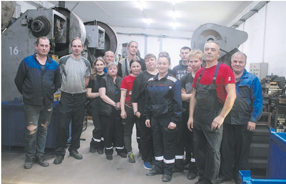
Коллектив механического и штамповочного участков