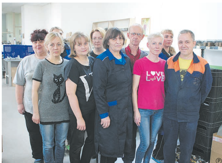
Коллективы инструментального участка (слева) и участка сборки