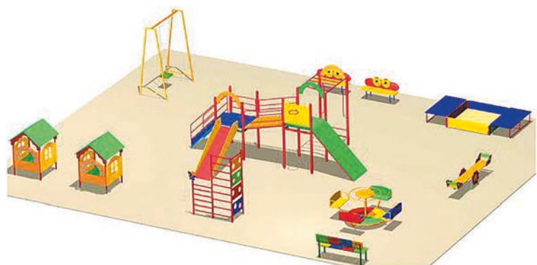
Благоустройство спортивной площадки на улице Чкалова между домами 33 и 39